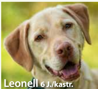
Leonell 6 J./kast.

Mitteilungsblätter erreichen 100% der Bevölkerung ihres Verbreitungsgebietes. Jeder Haushalt erhält monatlich ein Exemplar kostenlos.