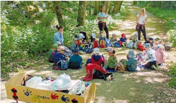
KiGa-Team St. Andreas, Kaldorf

Vor den Pfingstferien besuchten an 2 Tagen die verschiedenen Gruppen aus dem Kindergarten den Wald bei Kaldorf. Es wurden Holztipis gebaut und Tiere beobachtet. Viel zu schnell war die Zeit im Wald vorbei