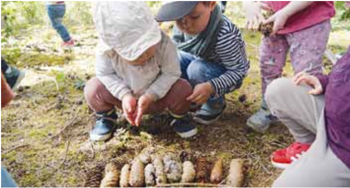
KiGa-Team St. Michael, Titting

und konnten ihrer Neugier beim Erkunden freien Lauf lassen. So bleiben die Waldtage für alle Beteiligten als besondere und schöne Erlebnisse in Erinnerung.