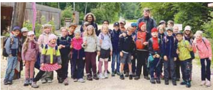
Die Schülerinnen und Schüler der 2. Klasse

Wir durften schleichen, balancieren, suchen, hören und staunen und hatten einen besonderen Schultag, der leider viel zu schnell verging.