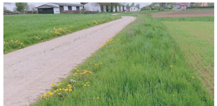
Blühender Löwenzahn, Taubnessel und Labkraut mit viel grasigem Grün in einem Wegrand - das Potenzial ist vorhanden und könnte bei entsprechender Pflege genutzt werden.

Optimal wäre eine ein- bis zweischürige Mahd mit Mähgutabfuhr, um die Flächen eher abzumagern, anstatt – wie beim Mulchen – das Material und damit auch die Nährstoffe auf der Fläche zu belassen. So würde sich ein eher krautiger, blütenreicher Bewuchs einstellen. Durch das Mulchen, ggf. bis zum blanken Boden werden eher konkurrenzstarke (Problem-)Gräser wie die Taube Trespe oder die Quecke gefördert, die auf der offenen Erde beste Entwicklungsbedingungen vorfinden und monotone Bestände bilden, welche sich gerne in die angrenzenden Flächen ausbreiten.