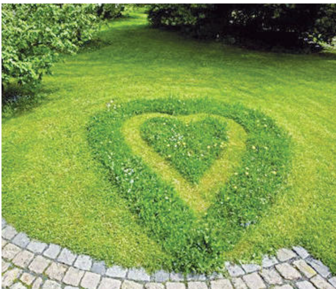
Der Kreativität beim Rasenmähen sind keine Grenzen gesetzt - Pflanzen und Tiere werden es danken, wenn ungemähte Bereiche stehen bleiben und blühen dürfen. (© Mein schöner Garten)