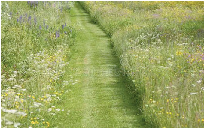
Braucht man so viel freie Rasenfläche oder reicht ein Weg zum Gehen und der Rest kann Blumenwiese sein?

Übrigens muss nicht zwangsläufig der gesamte Garten ungemäht bleiben – bereits ein Quadratmeter ist ein Anfang und bietet viel Entdeckungs- und Beobachtungspotenzial. Oder wie wäre es mit einem kreativen Wegnetz um weiterhin zum Kompost, dem Gemüsebeet und dem Wäschetrocknenplatz sowie der Gartenlaube zu gelangen, ohne das höher gewachsene Gras niederzutreten?