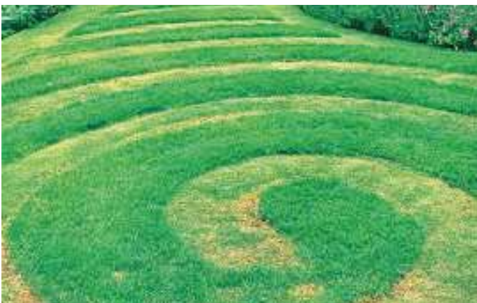
Gemähtes Kunstwerk

Die Deutsche Gartenbau-Gesellschaft 1822 e.V. ruft zusammen mit der Kampagne „Tausende Gärten – Tausende Arten“ und der Gartenakademie Rheinland-Pfalz schließlich dazu auf, auf einem Quadratmeter ungemähter Wiese den Mai über alle Blüten zu zählen und verlosen unter allen Teilnehmenden Preise.