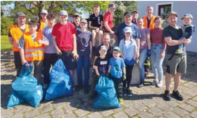
Im Rahmen der Aktion „Saubere Landschaft“ sammelten 20 fleißige Helferinnen und Helfer bei bestem Wetter den Unrat in den Fluren um Petersbuch. Anschließend gab es noch eine Brotzeit zur Stärkung.

Am 13. April 2024 fand im Markt Titting die Aktion „Saubere Landschaft“ statt. Diverse Vereine beteiligten sich in Titting und in den Ortsteilen und befreiten die Fluren von allerlei Unrat und Müll. Der gesammelte Müll wurde im Recyclinghof in Titting entsorgt. Die fleißigen Helfer, vor allem viele Kinder und Jugendliche, wurden vom Markt Titting und vom Landkreis Eichstätt mit einer Brotzeit unterstützt. Die Marktgemeinde bedankt sich bei allen Helferinnen und Helfern und den Ortssprechern sehr herzlich für den vorbildlichen Einsatz für eine saubere Natur und Landschaft.