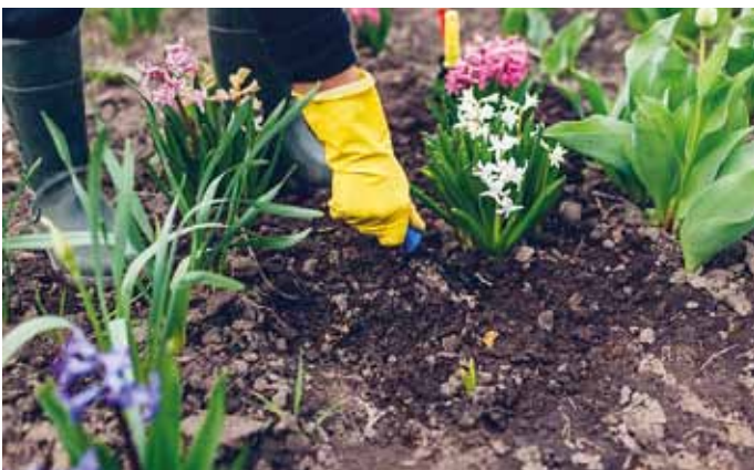
Gartenarbeit ist gut für die Gesundheit.