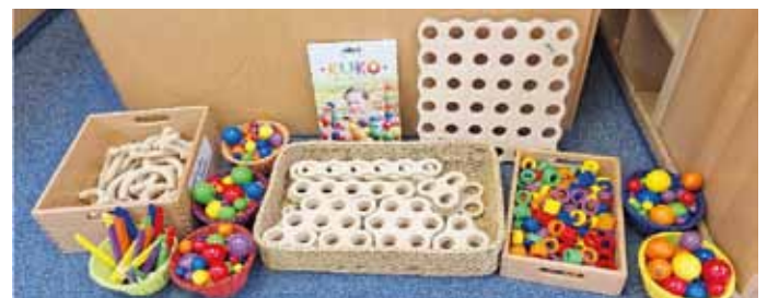
KiGa-Team St. Michael, Titting

Das Kugelkonzept ist für die Bauecke gedacht und kann von allen Altersstufen genutzt werden. Mit „KUKO“ kann man aus Kugeln fantastische Dinge bauen. Wir freuen uns schon auf die leuchtenden Augen, wenn die Kinder zum ersten Mal damit experimentieren können.