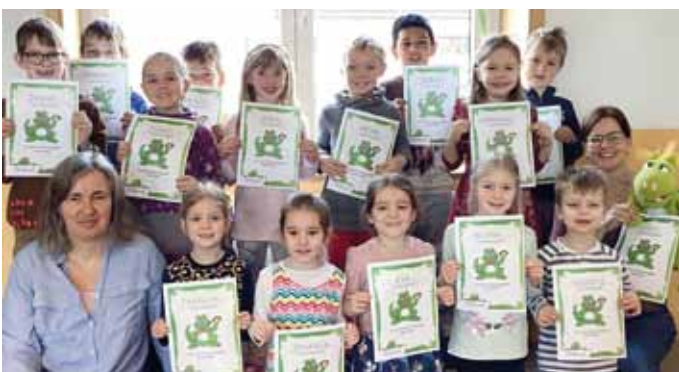
KiGa-Team St. Andreas, Kaldorf

Seit September haben sich die Vorschulkinder mit Geschichten, Spielen und Übungen mit dem Drachen „Lobo vom Globo“ beschäftigt. Ziel dieses Programms ist es, das phonologische Bewusstsein der Kinder auf spielerische Art zu fördern. Zum Abschluss dieses Lesevorbereitungskurses haben die Vorschulkinder von „Lobo“ ihre Urkunden erhalten.