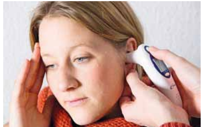
Bildunterschrift: Das finanzielle Risiko der Entgeltfortzahlung für kranke Beschäftigte können Arbeitgeber über die Umlage U1 absichern.

Weitere Informationen zum Thema Umlage gibt es im Internet unter www.aok-business.de/bay .