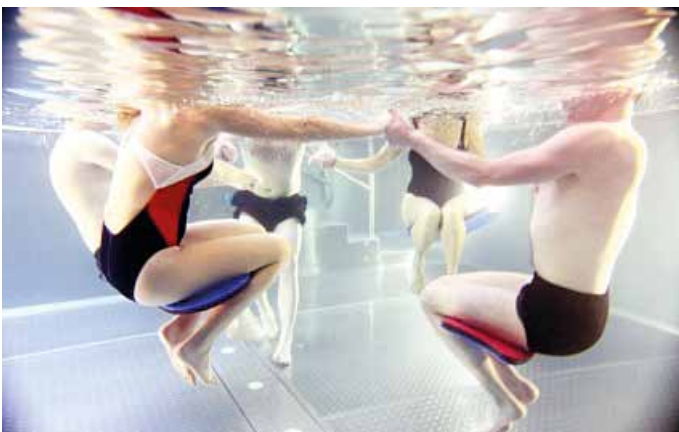
Beim Funktionstraining wird häufig Gymnastik im Wasser trainiert, weil Bewegung im Wasser die Gelenke entlastet.

Sowohl der Rehasport als auch das Funktionstraining finden in Gruppen statt, gemeinsam mit anderen Betroffenen. Sie arbeiten mit unterschiedlichen Mitteln, doch einen Zweck haben beide gemeinsam: Sowohl beim Rehasport als auch beim Funktionstraining ist das langfristige Ziel stets, dass man das Erlernte weiterverfolgt, also nach der Maßnahme möglichst selbstständig durchführt. Der gemeinsame Sport in der Gruppe und das Austauschen von Erfahrungen mit anderen Menschen mit Beeinträchtigungen kann dabei zusätzlich motivieren. Rehasport und Funktionstraining werden von der Ärztin oder vom Arzt verordnet. Die Verordnung geben Versicherte direkt bei der anerkannten Rehasport- bzw. Funktionstrainingsgruppe ab und können so umgehend mit den Übungseinheiten starten.