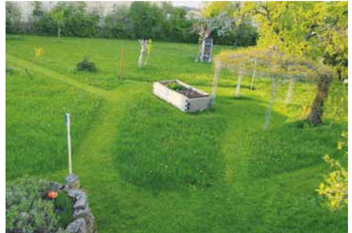
Gemähte Wege und Inseln in Blühwiesen-Garten

Bei Fragen zu diesem Thema können Sie sich gerne bei mir melden.