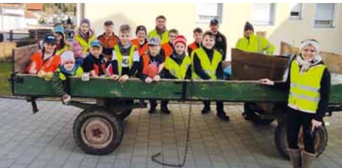
Morsbacher Kinder und Eltern helfen gemeinsam mit dem Jagdpächter Johann Hauf bei der Aktion Saubere Landschaft mit!