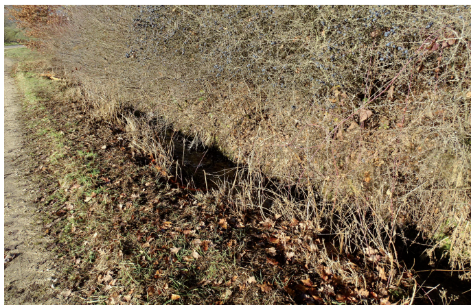
Vor der Herstellung der Ausbuchtungen war der Quellbach an der Klafferleiten-Quelle ein gerader, wegbegleitender Graben mit hoher Fließgeschwindigkeit – kein optimales Habitat für Feuersalamander-Larven und andere (Quell-)Bachbewohnende

Den guten Zustand der Quelle bestätigt auch der Nachweis von Feuersalamander-Larven in der Vergangenheit. Sie brauchen für ihre Entwicklung kühle, saubere und raubfischfreie kleine Gewässer mit beruhigten Fließbereichen. Nach zwei Mäandern änderte sich die Situation jedoch und der Quellbach verlief bisher als gerader, weg- begleitender Graben bis zur Verrohrung unter der Staatsstraße. Hier floss das Wasser mit hoher Geschwindigkeit ab, ein eher schwieriger Aufenthaltsort für die Feuersalamander-Jungtiere. Deshalb wurden kürzlich auf Empfehlung einer Quellen-Spezialisten des Landesbund für Vogel- und Naturschutz e.V. vom gemeindlichen Bauhof in diesem Bachabschnitt im Rahmen einer Gewässerunterhalts-Maßnahme Ausbuchtungen geschaffen, um das Spektrum der Fließgeschwindigkeit etwas zu erhöhen