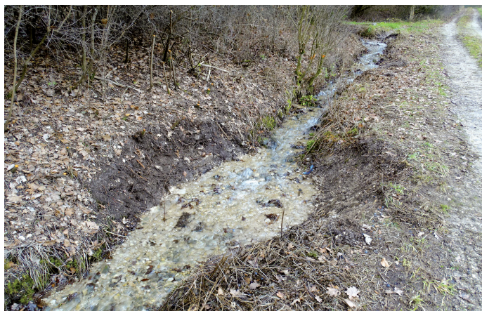
Durch Ausbuchtungen wird eine Veränderung der Fließdynamik im Klafferleiten-Quellbach erzeugt – in den ruhigeren Fließbereichen können sich zukünftig kleine Bachbewohner besser aufhalten.

und somit das Entwicklungshabitat für den Feuersalamander zu vergrößern.